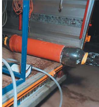
Obim »paker«-a se širi pomoću vazduha pod pritiskom i tako potiskuje crevo prema oštećenoj cevi. Crevo je obloženo tkaninom koja je prethodno impregnirana smolom.