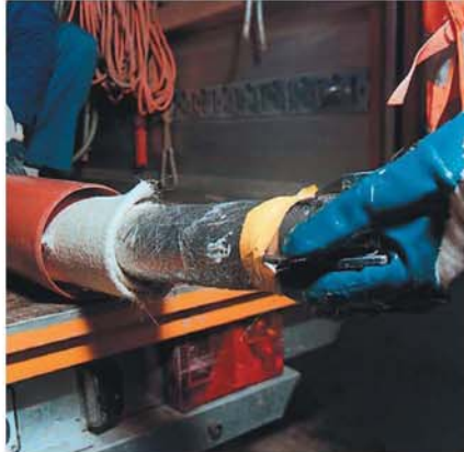
Postupak uvlačenja »paker«-a sa cevnim omotačem od impregnirane tkanine u oštećenu cev.

Na oštećenom mestu se obim »paker«-a pomoću vazduha pod pritiskom povećava a crevo od tkanine prijanja na zidove oštećene cevi. Višak poliuretanske smole curi napolje, popunjava i zatvara pukotine i rupe. Nakon kratkog vremenskog perioda poliuretanska smola se stvrdnjava i zajedno sa cevi i crevom od tkanine formira kompaktn spoj. Prečnik cevi se samo neznatno smanjuje. Nakon stvrdnjavanja ispušta se vazduh iz »paker«-a i vadi iz cevi.