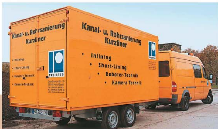
Kompletna jedinica za saniranje na točkovima.