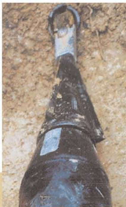
Glava noža sa dodatkom za proširivanje otvora.

Nakon uvlačenja šipke-poluge u stari cevovod vrši se pričvršćivanje noža za sečenje. Hidrauličnom vučnom silom nož seče staru cev, a njegov nastavak statičkim uvlačenjem obezbeđuje odgovarajući prečnik otvora. Povećavanje prečnika je lako izvodljivo.