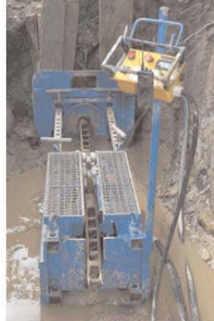
Postupak uvlačenja šipke u staru cev.